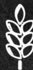
CEREALI CHE CONTENGONO GLUTINE