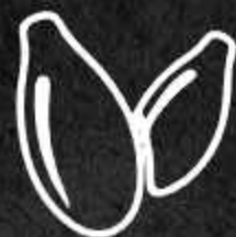
SEMI DI SESAMO